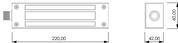
VENTOSAS MAGNETIC LOCK